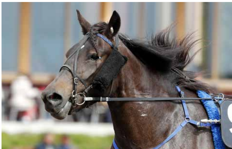
Se på Mig är nu inkvala även till det Norska Stokriteriet.

- Hon går från klarhet till klarhet och utvecklas något enormt. Hon var jättefin i försöket och vi fick ett lopp i andra ytter. Den i dödens kroknade väldigt 700 kvar så jag