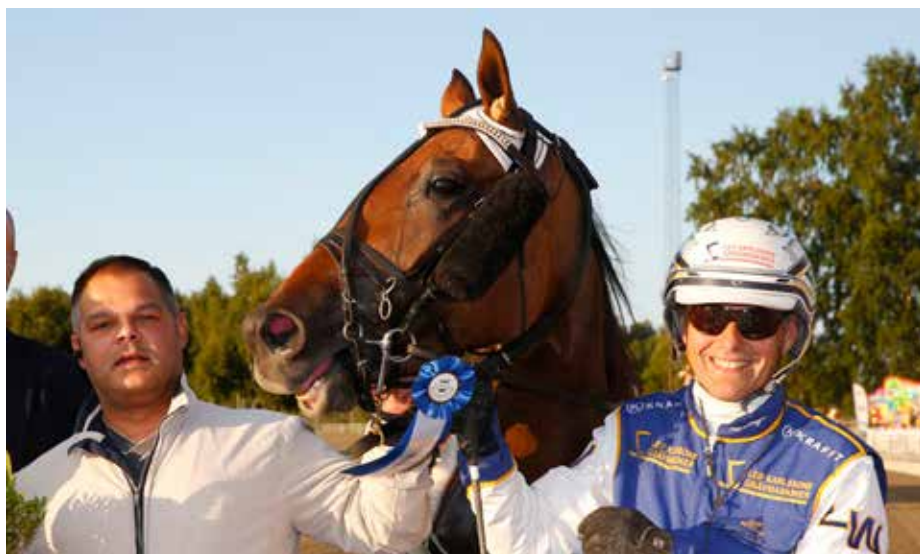
Glada miner efter Charmante Amoks imponerande seger i E3 Consolation.

Charmante Amok har gjort det mesta rätt i karriären så här långt men i uttagningarna till E3 hade hon tyvärr otur och det hela slutade med galopp i första sväng. I fredags fick hon dock revansch då hon vann E3 Consolation på ett mycket övertygande sätt. När startbilen släppte fältet tog hon direkt hand om ledningen och efter en snabb inledning fick Witasp lugna ner tempot en bit. Det blev sedan åter full körning sista halvvarvet och treåringen lämnade konkurrenterna med flera längder över