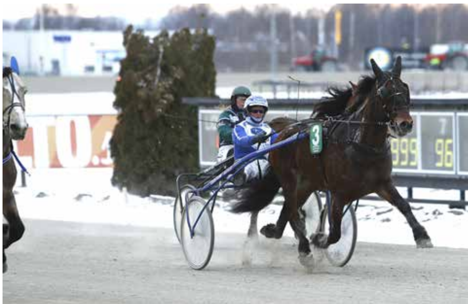
Västerbo Exclusive segerdefilerar efter stall Witasps första seger för året.

En gång är ingen gång, två gånger är en vana. Man kan ju alltid hoppas att Slotts Lynet även i fortsättningen tar för vana att sköta sig och dessutom vinna lopp. Igår tog han sin andra raka seger när han avgjorde på Romme. Efter ett lopp i andra-par utvändigt kom han fram utvändigt ledaren sedan täthästen galopperat in mot slutsvängen. När sedan även den nya ledaren slog på en galopp in på upploppet kunde Feseth Lynet-sonen gå undan till en lätt seger på 34,3/1640 m. Segern var värd 20.000 kronor och