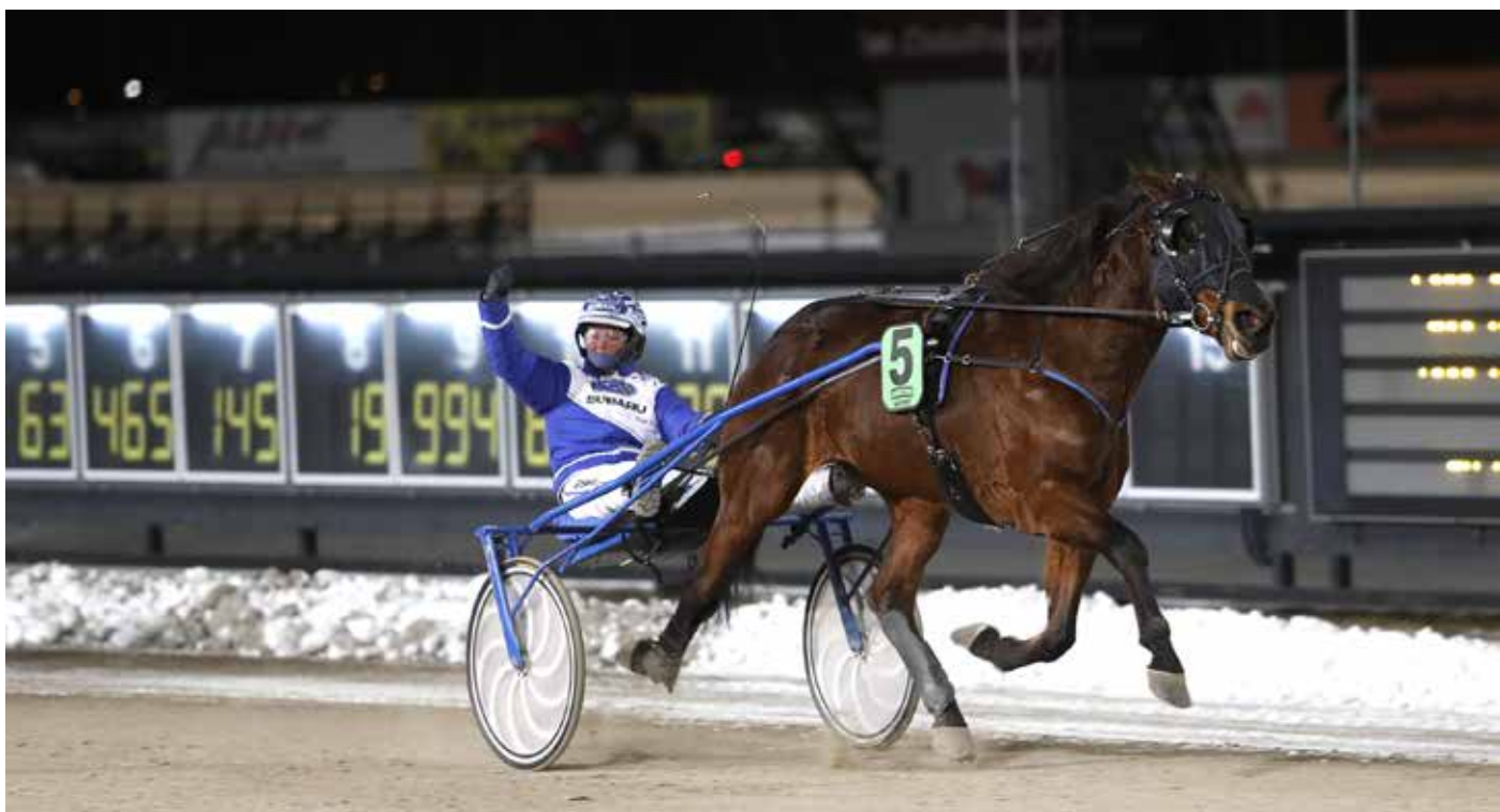
Västerbo Exclusive segerdefilerar efter stall Witasps första seger för året.