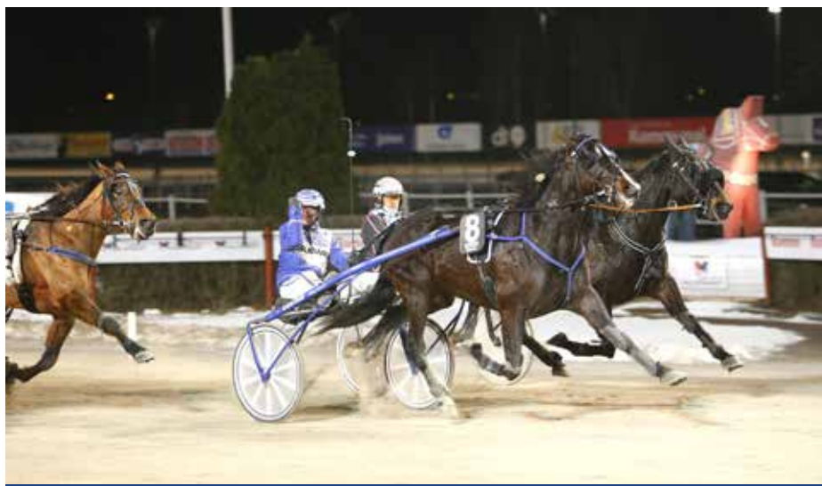
Västerbo Exclusive segerdefilerar efter stall Witasps första seger för året.

Kajsa Frick andades lite optimism inför Coyote Roadrunners start i fredags.