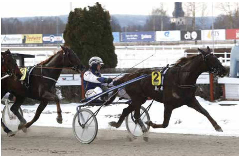
Västerbo Exclusive segerdefilerar efter stall Witasps första seger för året.

Bear Seat kvalade i oktober som tvååring och efter det slipade Leif Witasp till henne under vintern. Igår var det så dags för tävlingsdebut och treåringen visade då upp sig från sin bästa sida. Från inner-spår kunde Witasp enkelt behålla ledningen och fick andrahandsfavoriten M.T.Machiavelli på utsidan. Denne pressade på rejält på bortre långsidan men Bear Seat svarade enkelt och fick en längd till godo in i slutsvängen. Den marginalen höll hon sedan sista halvvarvet och Leif kunde sitta och finåka