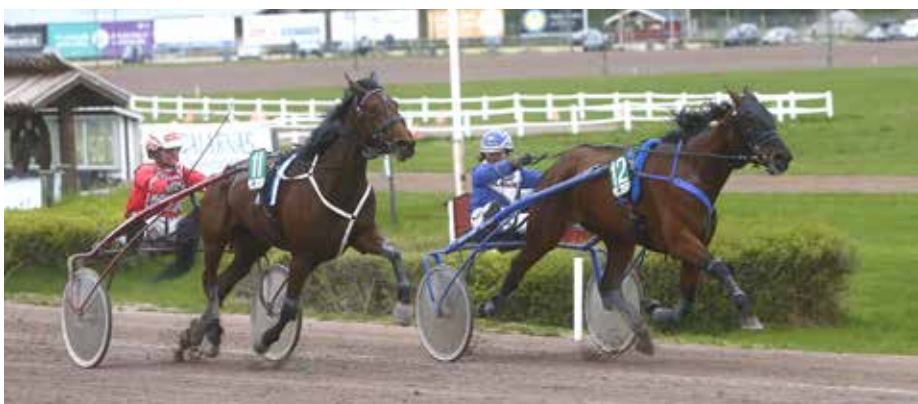
Trots en tung resa håller Baretime undan till en imponerande seger.

Kajsa inledde med Baretime som svarade för en femstjärnig insats. Efter att ha blivit hängande från start avancerade Frick framåt och kom fram utvändigt ledaren efter ett drygt halvvarv. På bortre långsidan pressades ledaren och 500 kvar tog femåringen över kommandot. Enjoy Lavec fick med sig My Made Journey som liftat med i rygg och dessa två gick undan sista halvvarvet. Baretime var dock den starkaste och höll undan till en säker seger på 15,9/2140 m. Stall