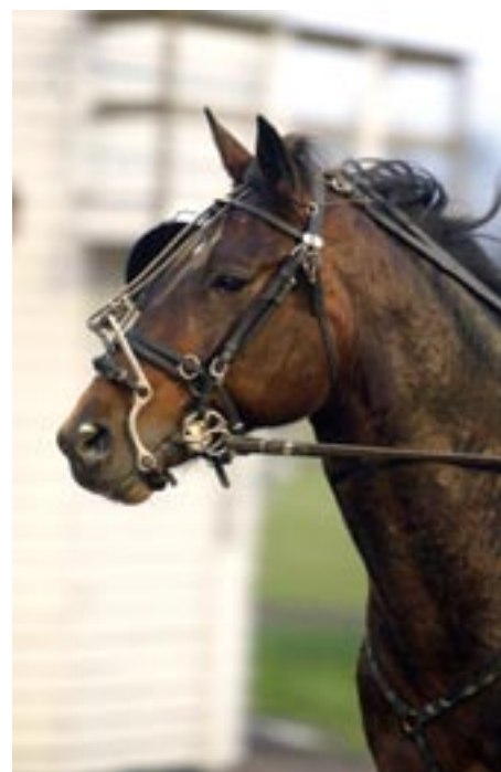
Cafu Cafe fixade årets första seger för stall Witasp.

Det behövdes drygt tre veckor in på det nya året innan första segern för stall Witasp kom.