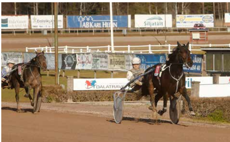
Rolling Hips avgör enkelt trots ett tungt lopp utvändigt ledaren.