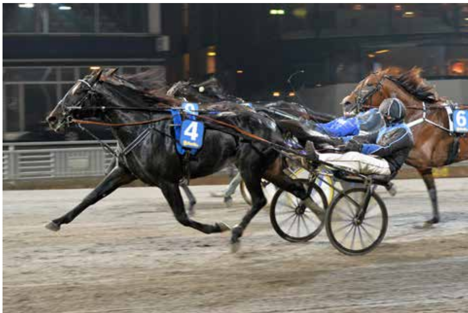
Cool Keeper håller undan till en säker seger i Breeder's Crown-semifinalen.

Igår drabbade landets bästa tre- och fyraåringar samman i Breeder's Crown-semifinaler på Solvalla.