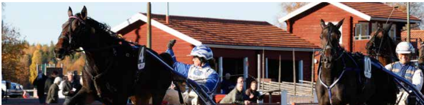
En nöjd tränare saluterar segern med Nah Neh Nah Face.

Igår gjorde Nah Neh Nah Face sin första start i regi Kajsa Frick.