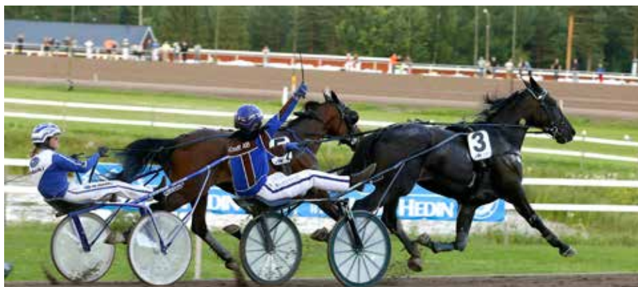
Illinois Rose och Kajsa slutar tvåa i uttagningen till Dam-SM men får ändå en finalbiljett.

Idag kördes uttagningslopp till Dam-SM på Rättvikstravet.