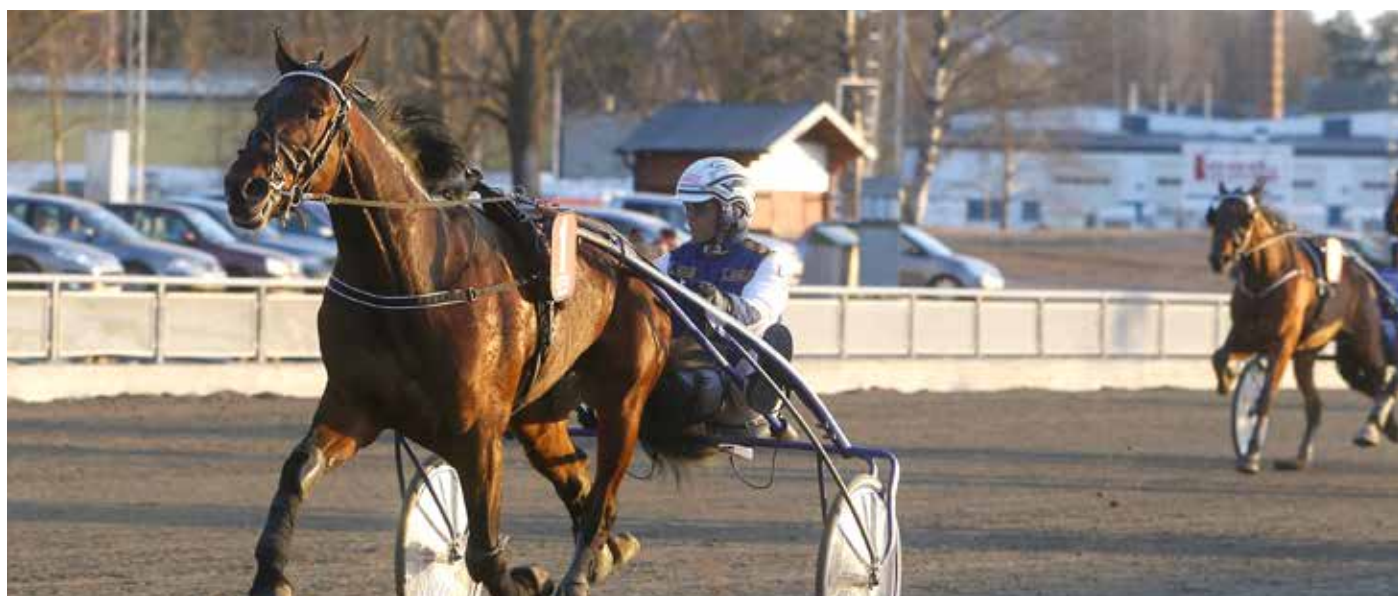
Big River Hanover bollar med konkurrenterna när han tar karriärens första seger.

I karriärens fjärde start blev kom äntligen segern för Big River Hanover.