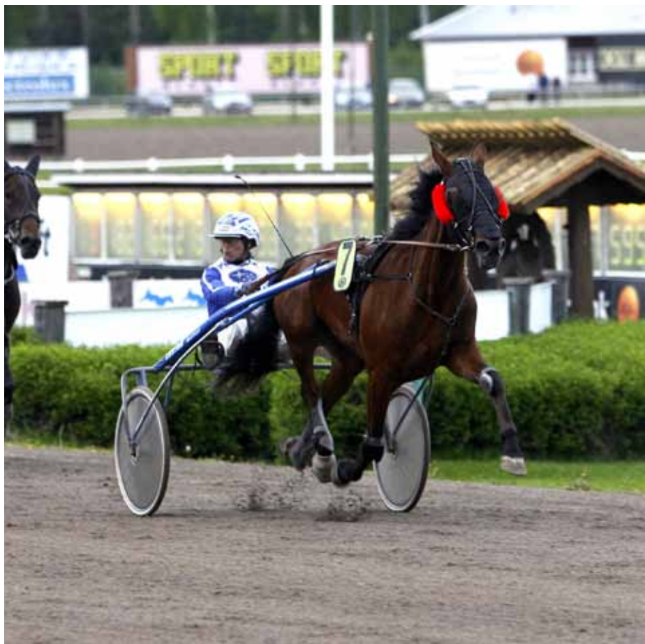
Blåblodiga Miss Wall Star svarade för en mersmakande debut som slutade med en lätt seger.

Mormor Lady Snärt vann 20 lopp och tjänade över 5 miljoner kronor.