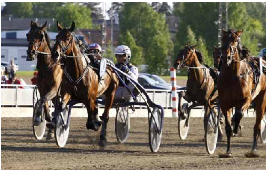
Mozart Töll avgör enkelt trots ett tungt lopp utvändigt ledaren.

Det blev en smårörig och galoppfylld inledning på loppet där Mozart Töll kom bra iväg från sitt bakspår och fanns som femma i första sväng, första häst i andraspår. Leif avvaktade sedan ett par längder bakom ledaren innan han gled framåt ut på sista bortre långsidan. 600 kvar var han framme utvändigt ledaren som dock ryckte undan med någon längd ur slutsvängen. Denne stumnade dock mitt på upploppet medan Mozart Töll farten och kunde avgöra säkert sista biten. Gigant Neo-sonen överraskade inte bara sin trä-