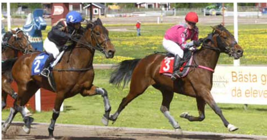
Turbolines håller undan för rappt avslutande stallkamraten Nova Race.