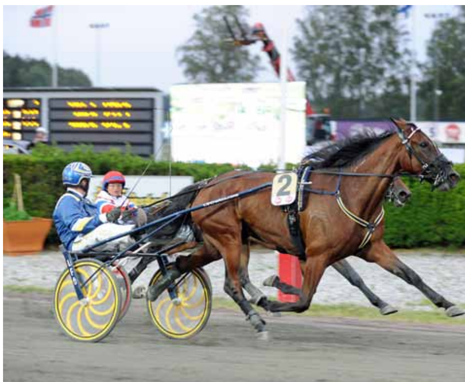
Invändige My Golden skjuter till vasst i E3-finalen.

Efter den imponerande insatsen i E3-försöket var det idag dags för My Golden att möta 11 av sina kullsysstrar i finalen. När startbilen släppte fältet var Adams Hall-dottern bra med och Kajsa droppade ner henne i andra-par utvändigt, i rygg på loppets stora favorit System Performance medan Queen Annes Lace tog hand om ledningen. Ställningarna förblev oförändrade till sista bortre långsidan då en av de stora förhandsfavoriterna från försöken, Creme Brulee attackerade i tredjespår. Det såg ut att lösa sig perfekt för Kajsa men finländaren blev kvar på hennes utsida och istället var My Golden fastlåst in på upploppet. 100 kvar kom dock luckan invändigt och