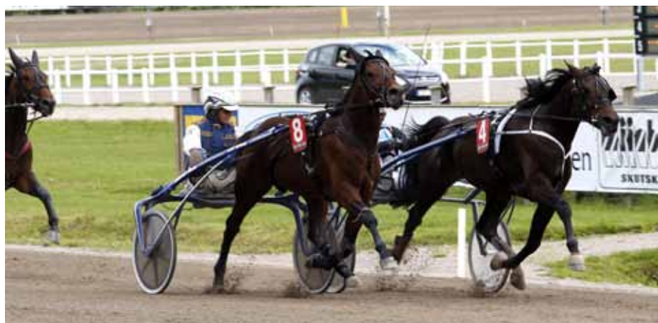
Trots lång frånvaro och ett lopp utvändigt ledaren vinner Diamond of Ace.