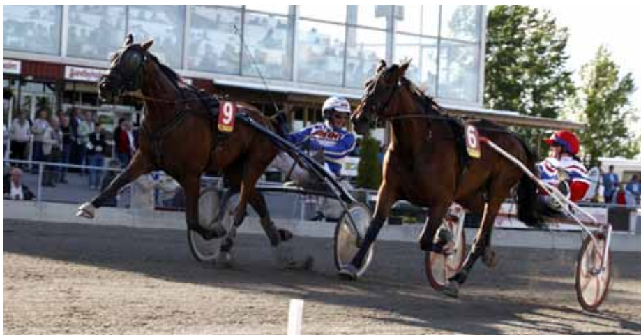
My Golden kvalar in till E3-finalen utan problem som knappt slagen i försöket.

Igår kördes uttagningsloppen till långa E3 som avgörs på Färjestad i slutet av månaden.