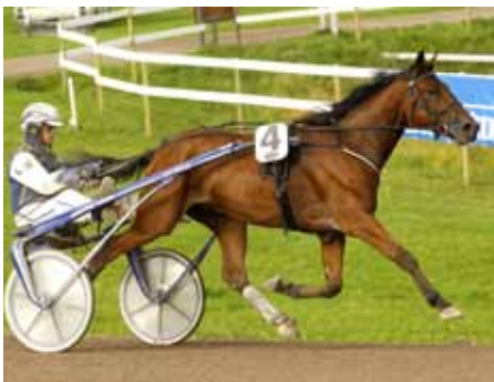
Turbo Sweden avslutar året på bästa sätt och går in i 2012 med tre raka segrar i bagaget.

Turbo Sweden fortsätter att skörda fina framgångar. Igår tog treåringen sin tredje raka seger.