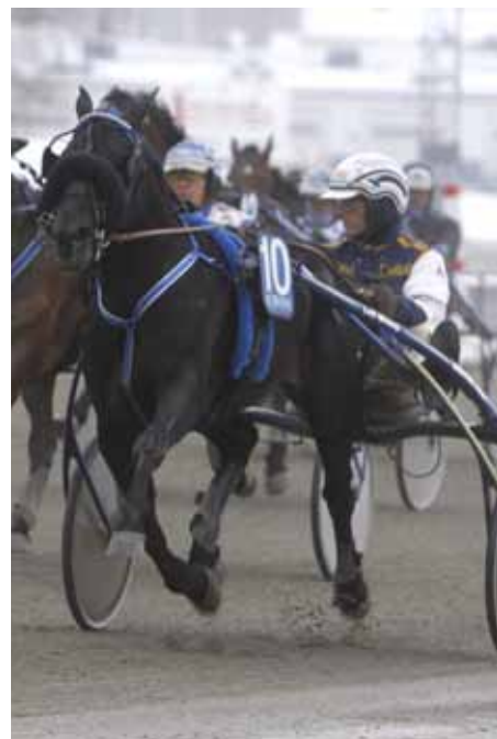
Slide to Third håller enkelt undan i årets sista start.